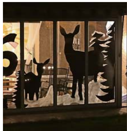
Einfach ohne Scheu reingucken und miterleben.

• Sa, 5.12.: Zürcher Weihnachten im Schweizer Film – eine Collage von 1957 bis heute. Dazu Isebahnle für